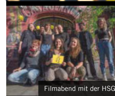
Filmabend mit der HSG