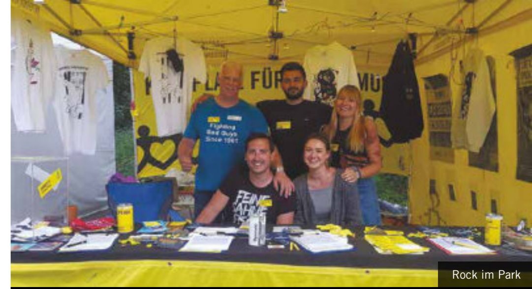
Rock im Park