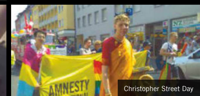
Christopher Street Day